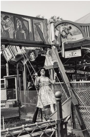
05 Im Prater, Österreich, Wien, 1961