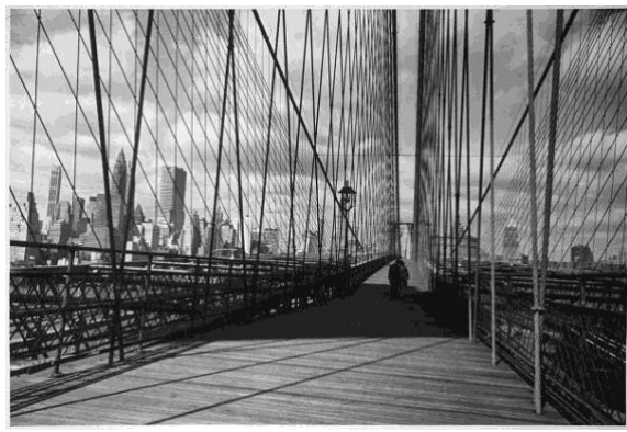
04 Down town, USA, New York City, 1961