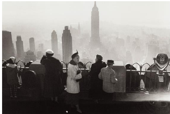
02 Ausblick vom Dach des Rockefeller Center, USA, New York City, 1958