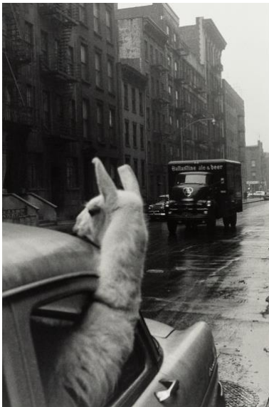
01 Ein Lama am Times Square, USA, New York City, 1957

Das Bildmaterial ist bei Nennung des Copyrights für die Veröffentlichung in Printmedien oder temporären Online-Publikationen freigegeben und darf ausschließlich in direktem Zusammenhang mit der Berichterstattung über die Ausstellung » The world as seen by Inge Morath « (09.12.2020–06.02.2021) in der Galerie OstLicht verwendet werden. Die Bilddateien müssen aus den Archiven nach Gebrauch entfernt werden.