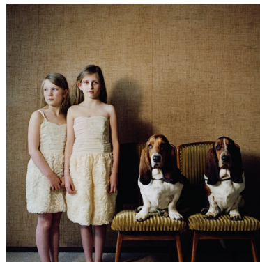
Hellen van Meene Untitled, 2012 Analoger C-Print, 39 x 39 cm