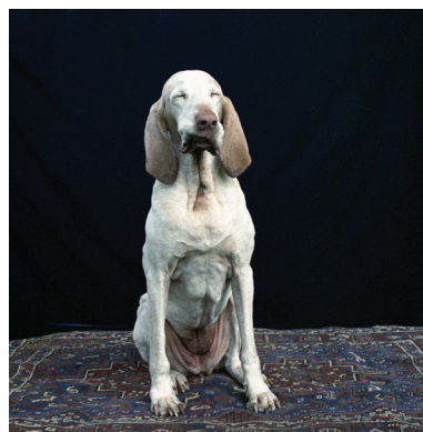
Hellen van Meene Untitled, 2011 Analoger C-Print, 70 x 70 cm