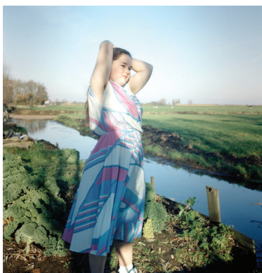
Hellen van Meene Untitled, 1996 Analoger C-Print, 29 x 29 cm © Hellen van Meene