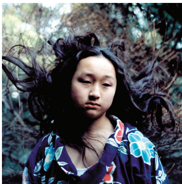
Hellen van Meene Untitled, 2000 Analoger C-Print, 39 x 39 cm