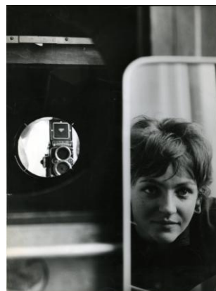
10 Selbstporträt ca. 1963/64