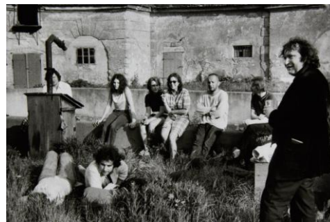
08 Hermann Nitsch Prinzendorf , ca. 1974