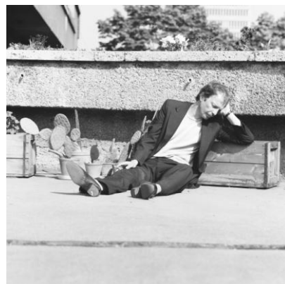
04 Franz West, #1 der 5-teiligen Serie aus der Werkgruppe „verwechslungen“, Wien, 1977