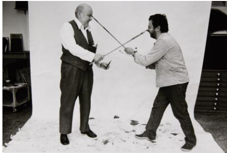
05 Dieter Roth und Arnulf Rainer, Misch- und Trennkunst 1974 © Fotosammlung OstLicht