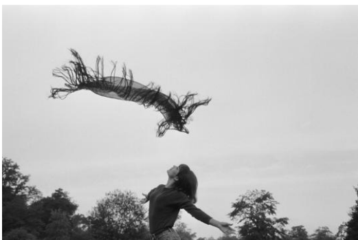
03 Spiel mit Tuch (Ulla) München, 1964/65