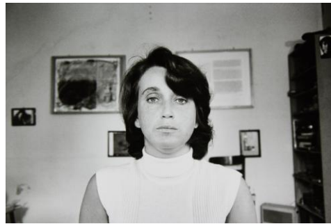
02 VALIE EXPORT Wien, 1975