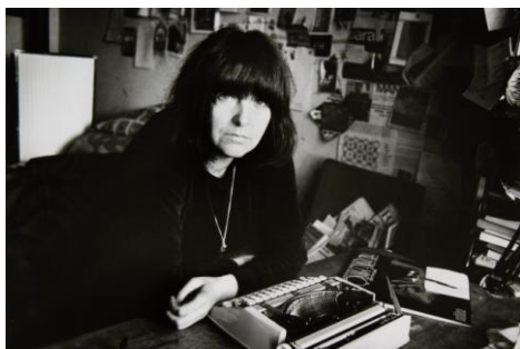
09 Friederike Mayröcker Wien, 1975