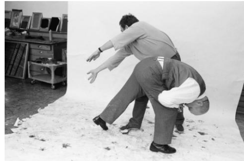
06 Dieter Roth und Arnulf Rainer, Misch- und Trennkunst 1974