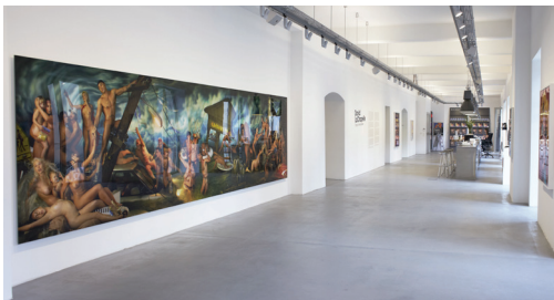
12. Ausstellungsansicht, Galerie OstLicht, DAVID LACHAPELLE. ONCE IN THE GARDEN