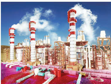
01. David LaChapelle Land Scape: Kings Dominion, 2013 © David LaChapelle

Das Bildmaterial ist bei Nennung des Copyrights für die Veröffentlichung in Printmedien oder temporären Online-Publikationen freigegeben und darf ausschließlich in direktem Zusammenhang der Berichterstattung über die Ausstellung DAVID LACHAPELLE. ONCE IN THE GARDEN in der Galerie OstLicht verwendet werden. Die Bilder dürfen weder beschnitten noch retuschiert werden. Bilddateien müssen aus den Archiven nach Gebrauch entfernt werden.