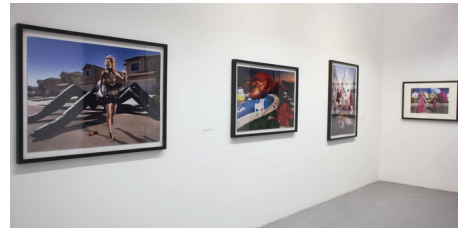
13. Ausstellungsansicht, Galerie OstLicht, DAVID LACHAPELLE. ONCE IN THE GARDEN