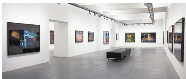
16. Ausstellungsansicht, Galerie OstLicht, DAVID LACHAPELLE. ONCE IN THE GARDEN