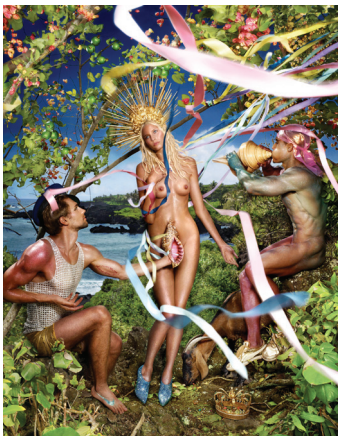
05. David LaChapelle Rebirth Of Venus, 2009