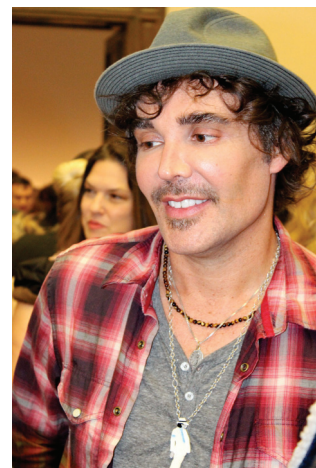
11. Portrait David LaChapelle