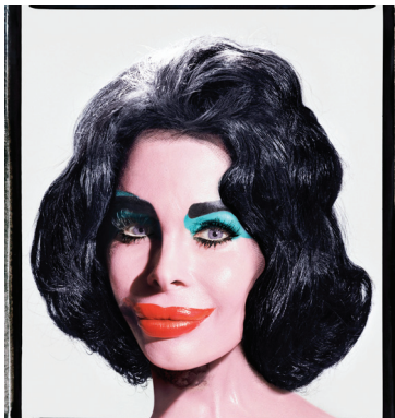
03. David LaChapelle Amanda As Andy Warhol's Liz, 2003