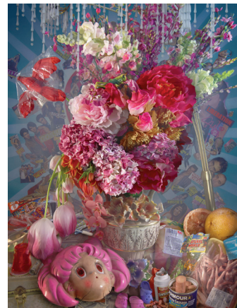
06. David LaChapelle Springtime, 2008-2011